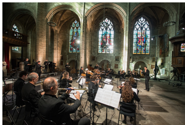
Photo concert Église Saint-Germain, 30 mars 2021

Ensembles en résidence à l'Opéra de Rennes