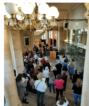
photo A chœur ouvert 2022

À l'Opéra de Rennes. Gratuit, sur inscription